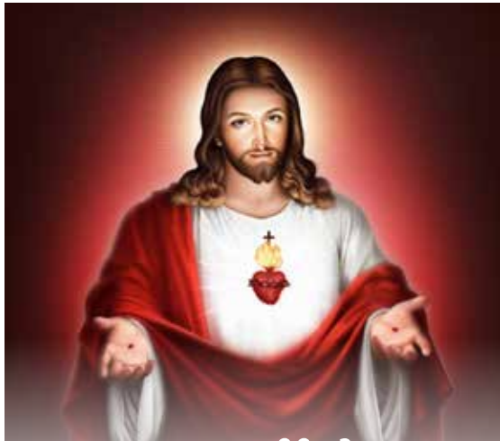
ധാരാളം ദൈവവിളികൾ നമ്മുടെ ചുറ്റുപാടുകളിൽ നിന്നും ഉണ്ടാകണമേയെന്ന് പ്രാർത്ഥിക്കുന്ന വ്യക്തികളായി നമുക്ക് മാറാം.

രണ്ടാമത്തെ പ്രധാന കാര്യം, ദൈവവിളി സ്വീകരിക്കുന്നവരുടെ ചുറ്റുപാടുകളിലുള്ള വിശ്വാസികളോട് പറയാനുള്ളതാണ്. അത് അവരുടെ മാതാപിതാക്കന്മാരായാകാം. സഹോദരങ്ങളായാകാം, സുഹൃത്തുക്കളായാകാം, ഗുരുഭൃതരായാകാം. ഈശോ പറയുന്ന പ്രധാനപ്പെട്ട കാര്യം, വിളവ് വളരെ അധികമാണ്; പക്ഷേ, വേലക്കാരില്ല; അവർക്ക് ഇടയനില്ല; ഇടയനില്ലാത്ത ആടുകളെപ്പോലെ അവർ പരിഭ്രാന്തരാണ്. നിങ്ങൾ ചെയ്യേണ്ട കാര്യം ഈശോ വളരെ കൃത്യമായി പറഞ്ഞുവെക്കുന്നുണ്ട്. ഈ വിളവ് ശേഖരിക്കുവാൻ ധാരാളം വേലക്കാരെ എവിടെ നിന്നെങ്കിലും കണ്ടുപിടിച്ചു കൊണ്ടുവരണം എന്നല്ല ഈശോ അവരോട് പറയുന്നത്. മറിച്ച് നിങ്ങൾ വിളവിന്റെ നാഥനോട് പ്രാർത്ഥിക്കുവിൻ എന്നാണ്. എന്റെ ഈ മകനെ / മകളെ ഒരു വൈദികനാക്കണമേ, സന്യാസിനിയാക്കണമേ എന്ന് ചിലപ്പോഴൊക്കെ ചില മാതാപിതാക്കന്മാർ പ്രാർത്ഥിക്കുന്നത് കണ്ടിട്ടുണ്ട്. അപ്രകാരമല്ല